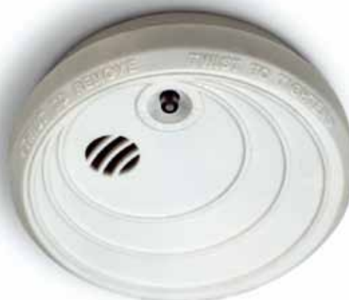
Det ska finnas minst en uppsatt och fungerande brandvarnare i varje lägenhet. Billigare liv- och egendomsförsäkring är svårt att hitta.

brandvarnare installeras, men att de boende sedan själva ansvarar för att regelbundet prova att den fungerar och byta batterier vid behov.