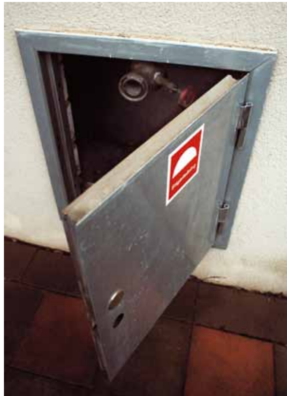
I stigarledningen i luckan på fasaden kan räddningstjänsten koppla in vatten. Inne i trapphuset finns sedan uttag där slangar kan anslutas.

I trapphus utgörs brandventilationen ibland av vanliga öppningsbara fönster. Det är viktigt att se till att lekande barn inte kan falla genom dessa. För att hindra olyckor kan exempelvis ett utvändigt galler användas.