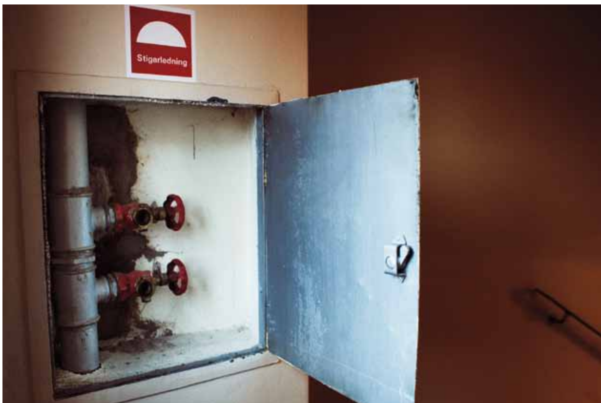
Via stigarledningen i trapphuset får räddningstjänsten vattenförsörjning utan att behöva dra slangar hela vägen från bottenvåningen.